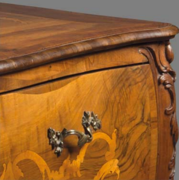
Giuseppe Maggiolini Commode 1760 ca

La nostra penisola si è sempre contraddistinta per la sua grande tradizione artigiana. Gli artigiani del legno tramandano ancora oggi la loro passione, coscienti di essere testimoni di una delle grandi arti italiane. Ogni azienda acquisisce la stima del mercato solo col tempo. Dal 1966 la famiglia Segato trasmette di padre in figlio i propri valori, facendo di ogni prodotto un autentico capolavoro.